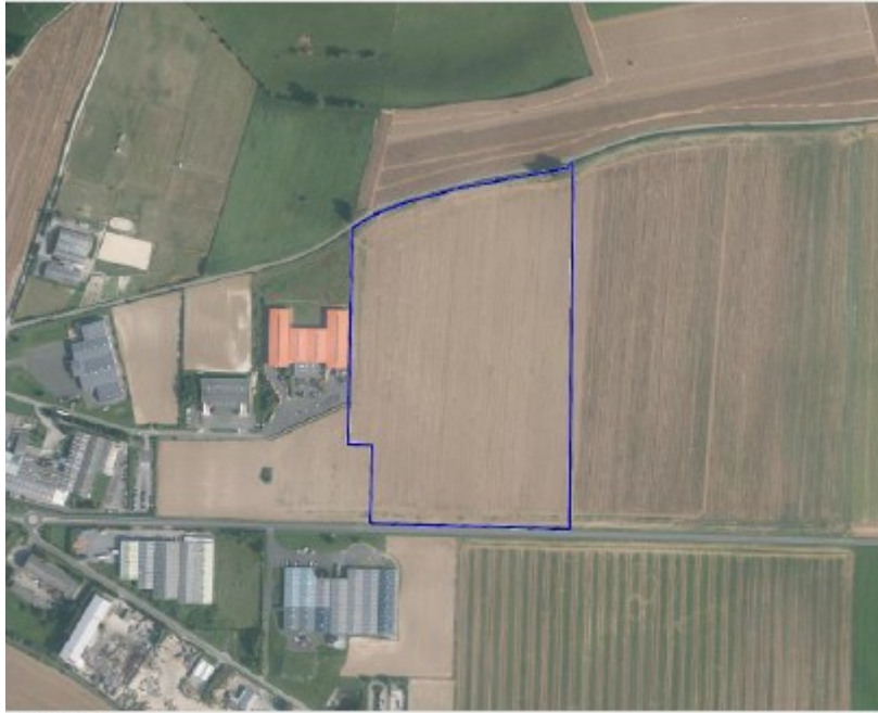
Vue rapprochée du projet

L'imperméabilisation concernera 103,5 m 2 pour un poste de livraison et deux de transformation. Aucune information n'est apportée au sujet des pistes d'accès, plateforme de levage, pieux.